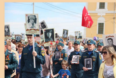
9 мая 2016 г. Бессмертный полк