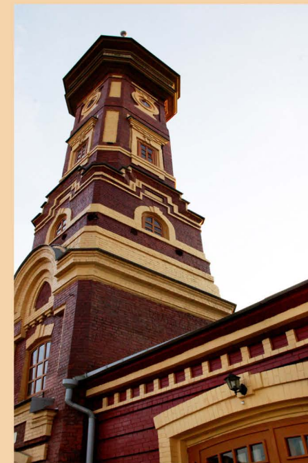
Здание отреставрировано по федеральной программе «Пожарная безопасность» в 2012 г.

Высота каланчи — 28 метров. По тем временам пожарная каланча была самым высоким сооружением в городе Иркутске. На каланче постоянно находился дежурный, который наблюдал за городом и сообщал о любом, самом малом возгорании. Для сигнализации использовали кожаные шары разных цветов, которые поднимали в определенном порядке в случае обнаружения открытого пожара. Каланчисты дежурили на каланче вплоть до 1956 года. Здание служило по назначению до 1989 года.