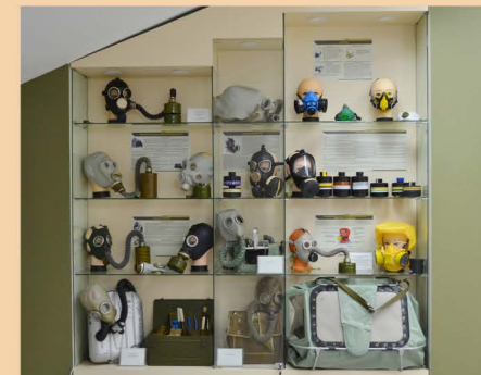
Средства индивидуальной защиты

10 марта 2016 года в музее открыта постоянная выставка «Авария на Чернобыльской АЭС 1986 г. Ликвидация последствий», посвященная 30-летию событий на ЧАЭС.