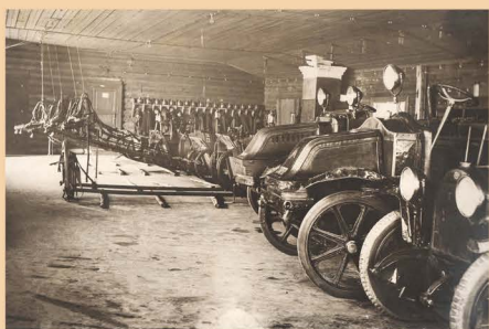
Фотография «Пожарное депо г. Черемхово. 1924 г.»

Постепенно Иркутское ДПО и Общество взаимного страхования от огня становятся значимой частью пожарной охраны Иркутска. С 1895 г. ДПО начинает быстро развиваться, число его членов достигает 113 человек, оно приобретает паровую пожарную трубу, ремонтирует заново пожарный обоз, становится вполне самостоятельной пожарной единицей. Общество Взаимного страхования от огня в 1901 г. формирует свой пожарный обоз.