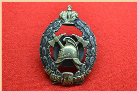
Отличительный знак Императорского Российского Пожарного Общества (ИРПО) с вензелем «В.А.» (Великий князь Владимир Александрович, почетный председатель Общества).