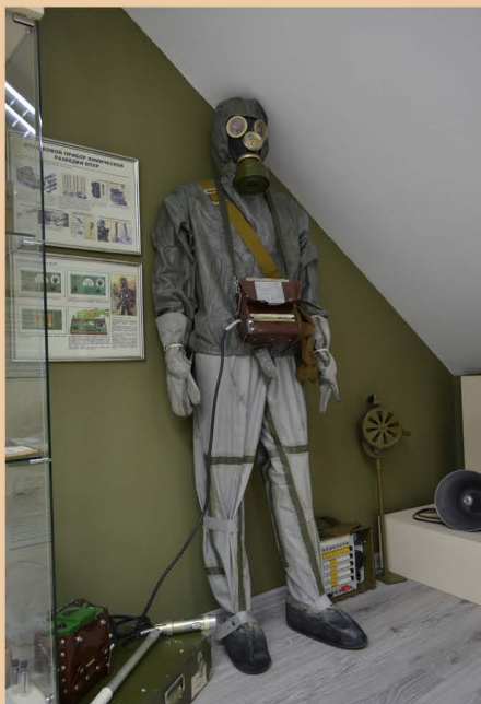
Манекен в Защитном костюме Л-1 с прибором ДП-5В