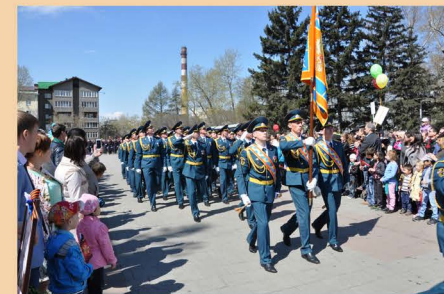
9 мая 2015 г.