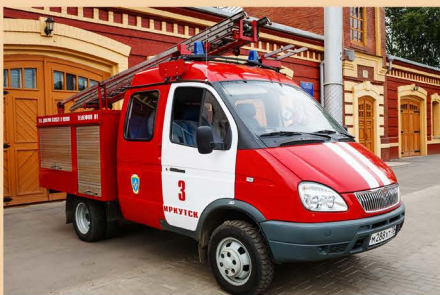
АПП-0,4 - 2 (330273)