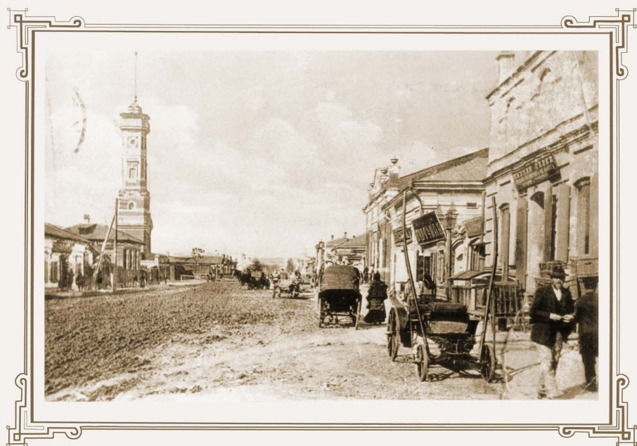
Новая 3-я пожарно-полицейская часть была построена на ул. Преображенской по решению городской думы