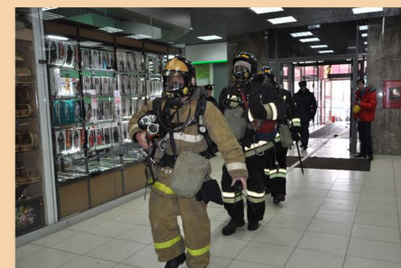
Учения в ТК г. Иркутска, 2016 г.