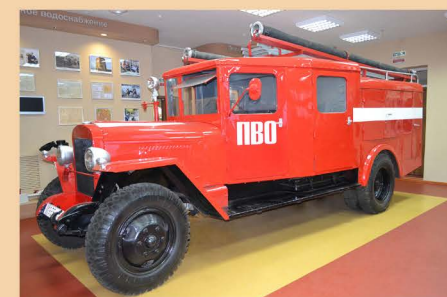
Автоцистерна ПМЗ-11 (ЗИС-5В)