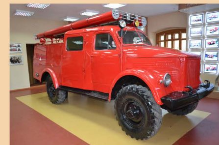
Автоцистерна АЦП-20 (63)