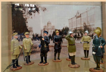
Диорама «Иркутские пожарные в конце XIX в.»