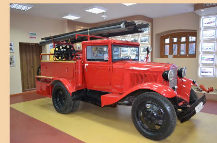
Пожарная машина ПМГ-1 (ГАЗ-АА)

В зале представлен конный трубно-бочечный ход , на котором установлены ручной пожарный насос производства АО «Лангензипень и К о » , бочка на 200 литров и ручная катушка с выкидными рукавами, уложены забирный рукав и подсобный инструмент