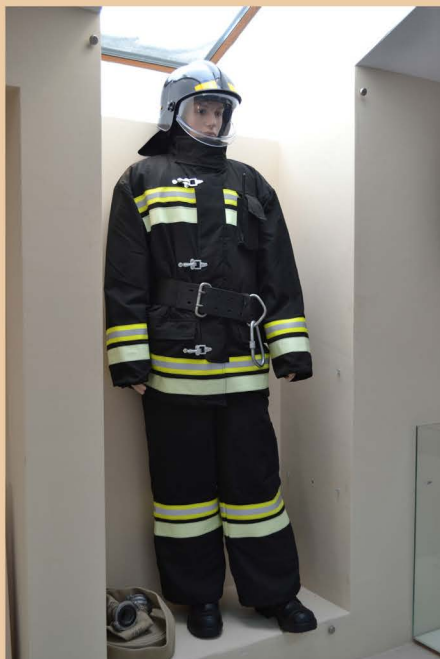
Боевая одежда пожарного