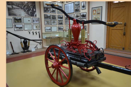
Ручной пожарный насос. Акционерное общество «Лангензипень и КО», г. Санкт-Петербург, на 2-х колесном ходу, не позднее 1917 г.

26 марта 1968 г. был подписан приказ МООП СССР об организации Иркутского пожарно-технического училища, эта дата стала днем его основания, а в январе 1978 г. открылся Иркутский