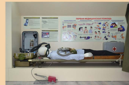
Первая помощь пострадавшему