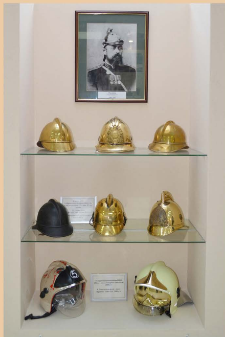
Коллекция пожарных касок

История и современный этап МЧС России, становление и развитие Единой государственной системы предупреждения и ликвидации чрезвычайных ситуаций находят свое отражение в экспозиции зала, тематических фотовыставках. Языком фотодокументов представлены хроника повседневной деятельности Главного управления МЧС России по Иркутской области, Байкальского поисково-спасательного отряда, спасательных служб и формирований территориальной подсистемы Иркутской области РСЧС России».