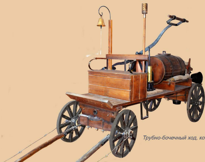
Трубно-бочечный ход, конец XIX в.