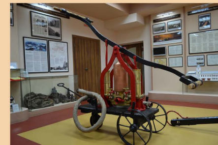
Ручной пожарный насос. Акционерное общество «Лангензипень и Ко» г. Санкт-Петербург, на 3-х колесном ходу с ручным управлением, не позднее 1917 г.