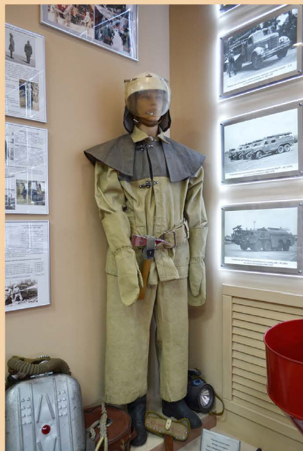
Манекен в БОП с КИП-8