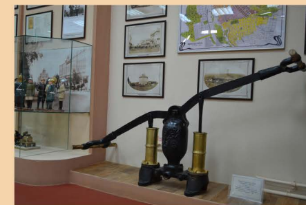
Ручной пожарный насос. Акционерное общество «Густав Листъ» г. Москва, не позднее 1917 г.